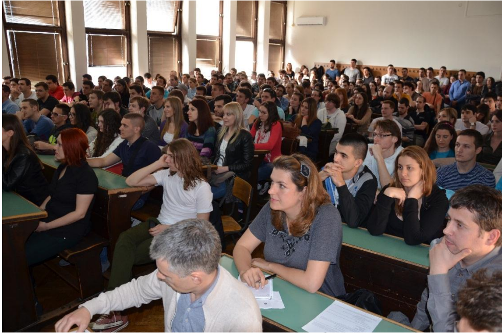
Слика 2 – Сремни за почетак