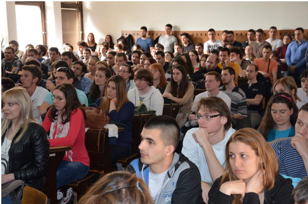
Слика 3 - Још једно у низу предавања у нашој чувеној учионици 706